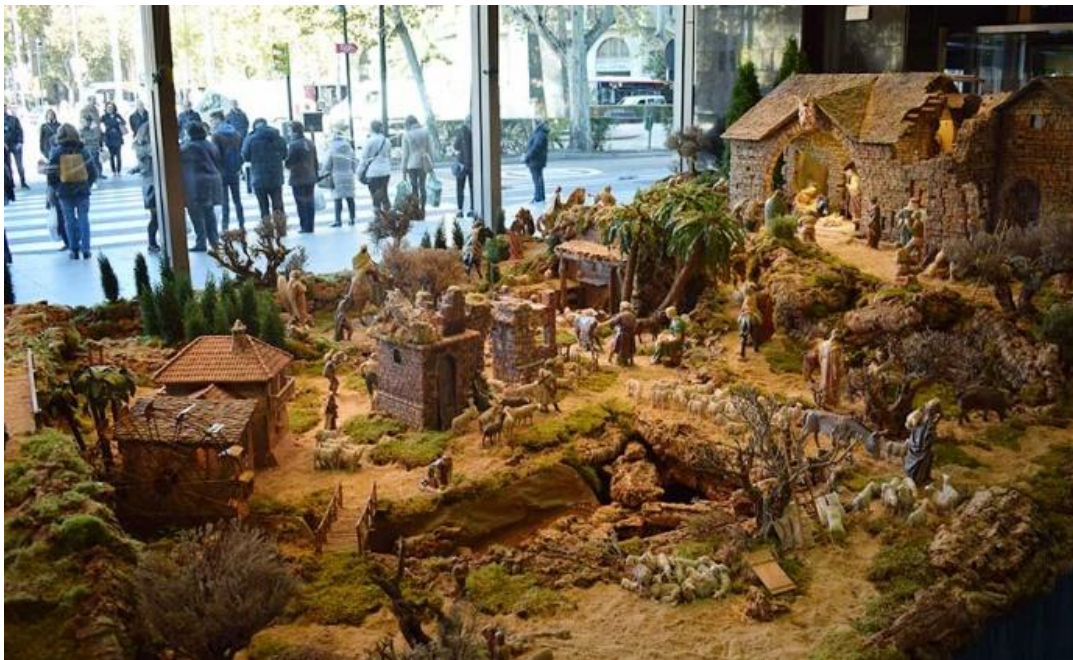
Belén de Ibercaja en Zaragoza